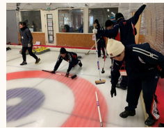
▲氷上でもへっちゃんら

特進コース、一貫コースは一足先にアントレプレナーシップを開始。テーマは「理想の高校をつくろう!」で、各班に分かれて収支計画などを立案します。