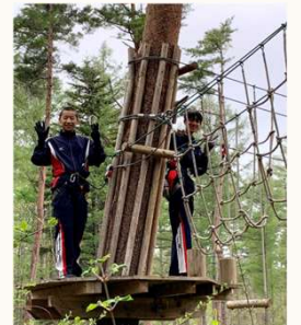
▲笑顔で余裕のピース

スポーツサイエンスコースは、2日目も引き続き、体を存分に動かすスケジュールで進行していきます。フォレストアドベンチャーフジにて、大自然の空気を肌に感じながら、コースを満喫することができたようです。午後にはチームビルディングについての研修も受けました。