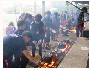
▲上手に炊けるかドキドキ

あいにくの雨でしたが中学生は富士山レーダードームを見学。お昼には一貫コースの中高合同で飯盒炊爨とカレー作りを行いました。薪の用意から皿洗いまで、先輩として中学生に優しく教える高校生と、そんな先輩に無邪気についていく中学生の姿がありました。