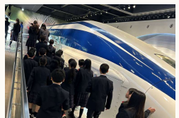
▲リニアの迫りに圧倒

最終日、高校生は富士急ハイランドに、中学生はリニアセンターを見学。それぞれアトラクションに乗ったりと楽しんでいました。友達との仲間もグッと深まり、楽しい思い出をたくさん作れたようです。