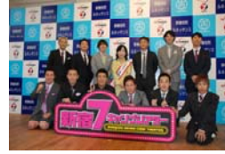
平成20年7月14日～8月31日 よしもと笑い演劇 「新宿7キャンシアター」