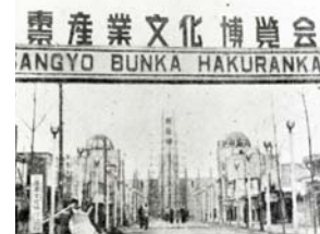
東京産業文化博覧会場