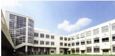
校舎全体をそのまま活用