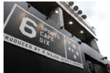
東京都健康プラザハイジア