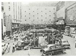
新宿ミラノ座(現TOKYU MILANO)・ シネシティ広場