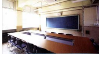
教室をオフィス・会議室として活用