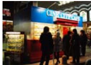
コマ劇場閉館後の賑わい創出