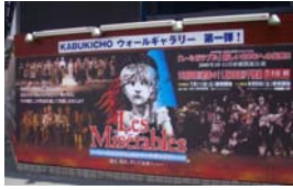
旧コマ劇場仮囲い 「ウォールギャラリー」