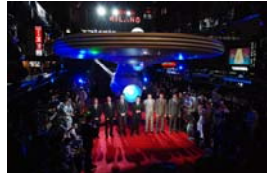
平成21年5月12日 「スタートレックプレミアイベント」