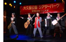
平成21年6月16日 「大久保公園シアターパーク」 オープニングイベント