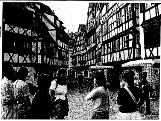
講義の後、実際にストラスプールの街に。歴史的建造物の街並みに圧倒される