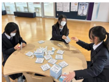
◀ メモ用紙を製本する様子