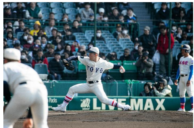
甲子園仕様のユニフォーム (右肩に大学ロゴ、左肩に校章)

以上、選手経費として宿泊費、交通費、食費の他、ユニフォーム、スパイク、バット、靴、ボール、ヘルメット、捕手用具等の購入に使用させていただきました。