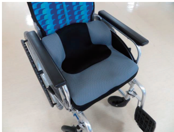
図1 車いすに装着したLAPSの外観

このクッションはタカノ株式会社との共同開発ですが、腰椎(Lumber)、アンカー(Anchor)、骨盤(Pelvis)をSupportする機能を持つことから、頭文字をとってLAPSとネーミングし、2014年5月から発売を開始しました。