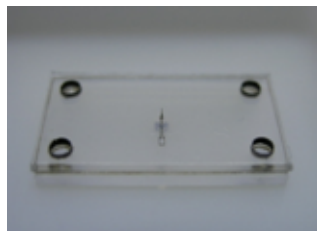
図2 採血と重力利用血漿分離デバイス