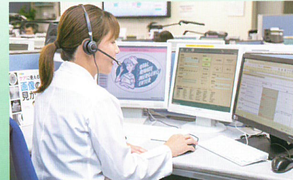
ご相談に対応するヘルスカウンセラー