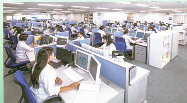
メディカルコールセンター

■ティーベックの相談スタッフ（平成28年7月現在） ドクター……………159名 ヘルスカウンセラー……………179名 （保健師・助産師・看護師・心理カウンセラー・ケアマネジャー などキャリアのある相談スタッフ） オペレーター……………82名