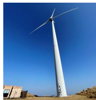
風力発電のような炭素を排出しない再生可能エネルギーへの転換は必須と言える（松本准教授撮影）

カーボンプライシングもESG投資も、一見すると企業にしか関係のない制度のように思えます。しかし、企業が作った製品を購入し、消費するのはわれわれ最終消費者です。気候変動の緩和策が進む中で、消費財への価格転嫁が進み、値段が上がることもあるでしょう。そうした状況になった際に、何が環境にとって良いのかを考え、一人ひとりが最適だと思う選択をすることで、よりよい世界を実現できると考えています。