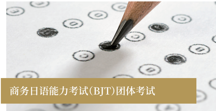
商务日语能力考试(BJT)团体考试