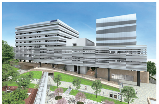
2024年竣工の新校舎(朝霞)

博士前期課程は、高度な倫理観によって、生命と健康、次世代の食品開発や食の安全に係る分野において、指導的役割を果たすとともに、国際的に活躍できるような高度な専門能力を有する実務スペシャリストを育成します。博士後期課程は、グローバルな視点から食を取り巻く環境を科学的に考察し、国際的な幅広い視野に立つて、更に高度な知識と研究能力を有し、世界・日本社会が直面する多様な食環境科学領域での諸問題に対して、解決に向けた強い責任感と倫理観をもって、新たなイノベーションを創造して解決を図る研究者、技術者、教育者等の人材を育成します。