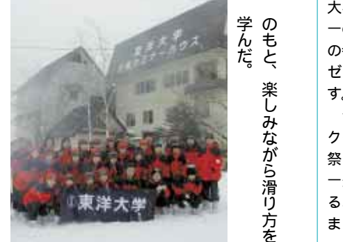
のも、楽しみながら滑り方を学んだ。

5月24日(土) 朝霞キャンパスにおいて第44回東洋大学体育祭が開催されます(主催:体育祭実行委員会・雨天決行) 体育祭は学部・学年・キャンパスといった垣根を越え、東洋大学の全学生が交流できる唯一のイベントです。サークルでの参加はもちろん、友達同士やゼミ単位での参加も大歓迎です。 今年、大玉送りやフォークダンスなど、今までの体育祭にはない競技を取り入れ、一般学生にも楽しんでもらえるような内容になっています。また、新たな試みとして模擬店を出店する予定なので、競技の合い間などにぜひ利用してみてください。 昨年同様、豪華な賞品を多数取り揃えていますので、一つでも多くの競技に参加して、賞品を勝ち取ってください。 当日参加が可能な競技種目 ・学部対抗綱引き ・障害物競走 ・リレー ・筋肉番付 ・大玉送り ・フォークダンス ・東洋ウルトラクイズ ・テニストーナメント ソフトボール ・3 on 3(バスケットボール)その他のイベント ・フィールドマーチング ・チャリディング *詳細は各キャンパス学生生活担当事務局窓口、または学内掲示のポスターで確認してください。