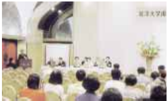
「東洋大学デー in 新潟」(昨年7月)の中で南水会支部総会を実施