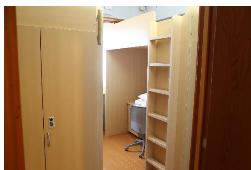
相部屋の寝室（下部がデスク、上部がベッド）