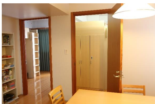
個室の寝室（左）と相部屋の寝室（右）