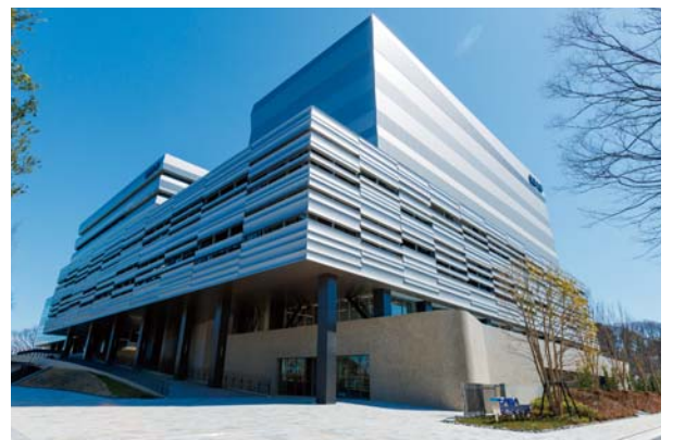
新朝霞キャンパス

本研究科では、学部4年次の卒業研究において取り組んだテーマをさらに追求し、食品科学者としての個性を磨いていきます。皆さんが大学院で取り組む研究は食品科学という広大な分野におけるさまざまな課題を解決するケーススタディとなります。実験結果を積み上げて課題解決の糸口をつかみ、報告するまでの一連の科学的活動を営むことにより、個人でそしてチームであらゆる課題に挑戦していくために必要なあらゆる能力と技術を養うことができます。食品科学分野において人類が抱える問題を解決できる科学者を育成します。