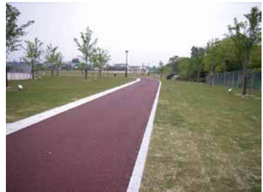
ジョギングコース