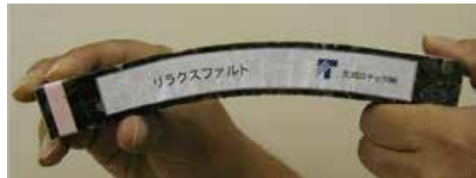
たわみ性に優れる特殊アスファルト