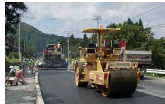
製造や施工は通常のアスファルト舗装と同じ