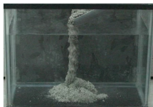
水中不分離性重量コンクリート

産学共同研究の一環として、東洋大学と東洋建設(株)との共同で開発した技術であり、下欄に示す特許を出願いたしました。