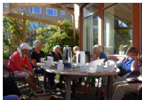
Sockenstugan の共用食堂と アウトリビング