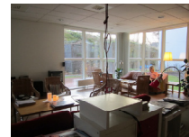
Sjöfarten, Dunderbacken の 共用食堂とリビング