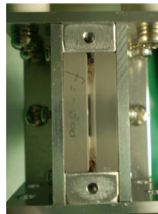
図2 ガラスイオン流路の正面写真