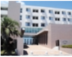
セミナーハウスは山中湖・白馬・富士見高原・鶴川(写真)の4か所にあります

セミナーハウスの使用料について、平成18年4月1日宿泊分より下記の通り変更します。詳細は、学生生活担当課へお問い合わせ下さい。