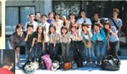
昨晩の疲れも見せず、元気に記念撮影。