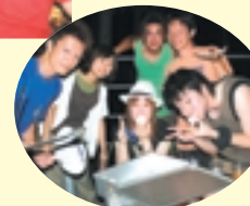
「セミナーハウスの利用は初めて」という人も。友達にもどどんと宣伝してください。