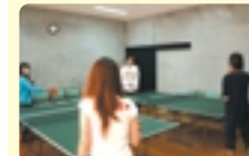
旅行先の卓球ってなんであんなに自然なんですよ