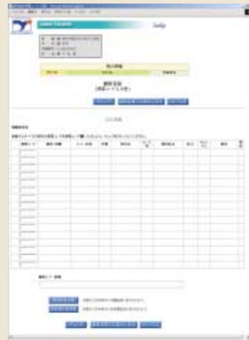
履修登録(授業コード入力型)