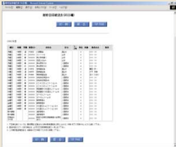
履修登録確認表(科目欄)