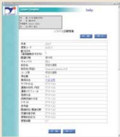
シラバス詳細情報