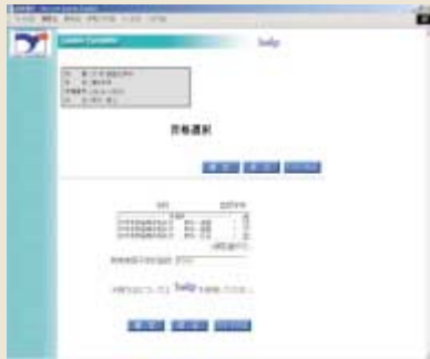
資格取得・コース希望登録(例:教職選択)