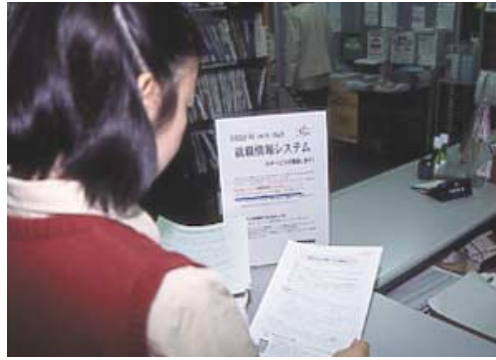
「東洋大学Web情報システム利用ガイド」には、システムの機能や実際の入力・検索方法などが説明されています。

就職情報システムの稼働により、本学が受け付けた求人情報の検索等がWeb上で簡単にできるようになりました。すでに3・4年生の皆さんには11月21日からサービスを開始していますので、利用している人も多いかと思えます。1・2年生用のサービスは、2003年の4月より開始予定です。就職活動前の業界研究・企業研究に役立ててください。また、利用に際しての手引書、東洋大学Web情報システム利用ガイドは、各キャンパスの就職資料室に置いてありますのでご自由にお持ちください。その中の4ページ目から就職情報システムの「案内」となっています。