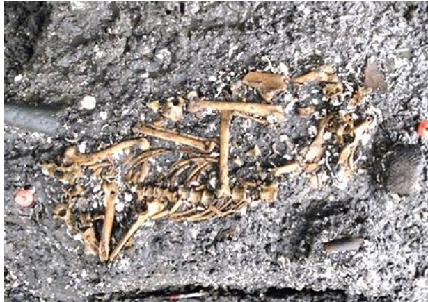
縄文時代における犬の埋葬

縄文時代の人々は、中・小型動物を射とめる狩猟具の [A] を開発し、狩猟にはイヌを使った。イヌが狩りのパートナーであったことは、イヌの埋葬例が墓地機能をもった [B] から数多くみつまっていることからわかる。