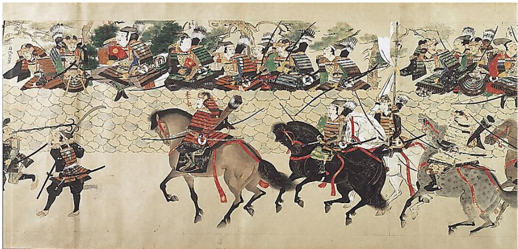
もうこしゆうらいえことば 『蒙古襲来絵詞』 ( ぼうるい 防塁付近で けいご 警固に ごけにん 当たる御家人ら)

問8 下の図はア～キの短文うち、どのできごとを示しているか。ア～キより一つ選びなさい。