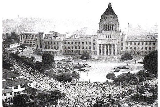
(60年安保闘争 とうそう )