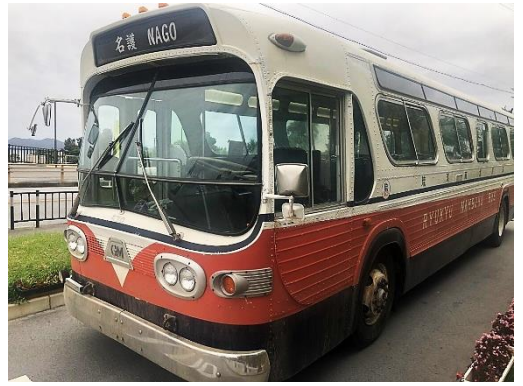
(反対ドアのバス)