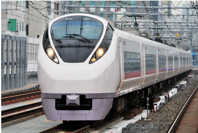
特急 G 号 (東日本旅客鉄道HPより)

律令国家を目指した日本は、8世紀初頭に中央行政組織および地方組織の整備に力を注いだ。全国を畿内という中心部と七道という地方に区分し、その下に国・郡・里(のち郷)がおかれた。茨城県にあたる地域は、当時「 G のくに」と呼ばれ、現在、東日本旅客鉄道(JR 東日本)常磐線で運行している特急列車名の由来にもなっている。