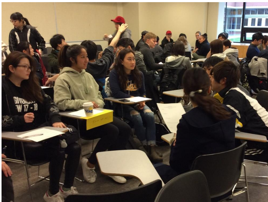
Day 1 : グループ討議風景

なお、この合同セミナーは、両大学の学生からたいへん好評でしたので、平成 30 年も引き続き実施されることになりました。内容もさらに濃くなる予定です。乞うご期待！