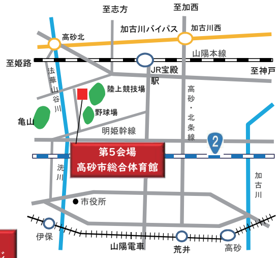
第5会場（高砂市総合体育館）JR宝殿駅下車徒歩15分