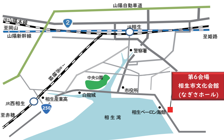
第6会場（なぎさホール） 当日はJR相生駅南からシャトルバス運行 神姫バス…相生駅発 相生港行き「相生港(なぎさホール前)」下車